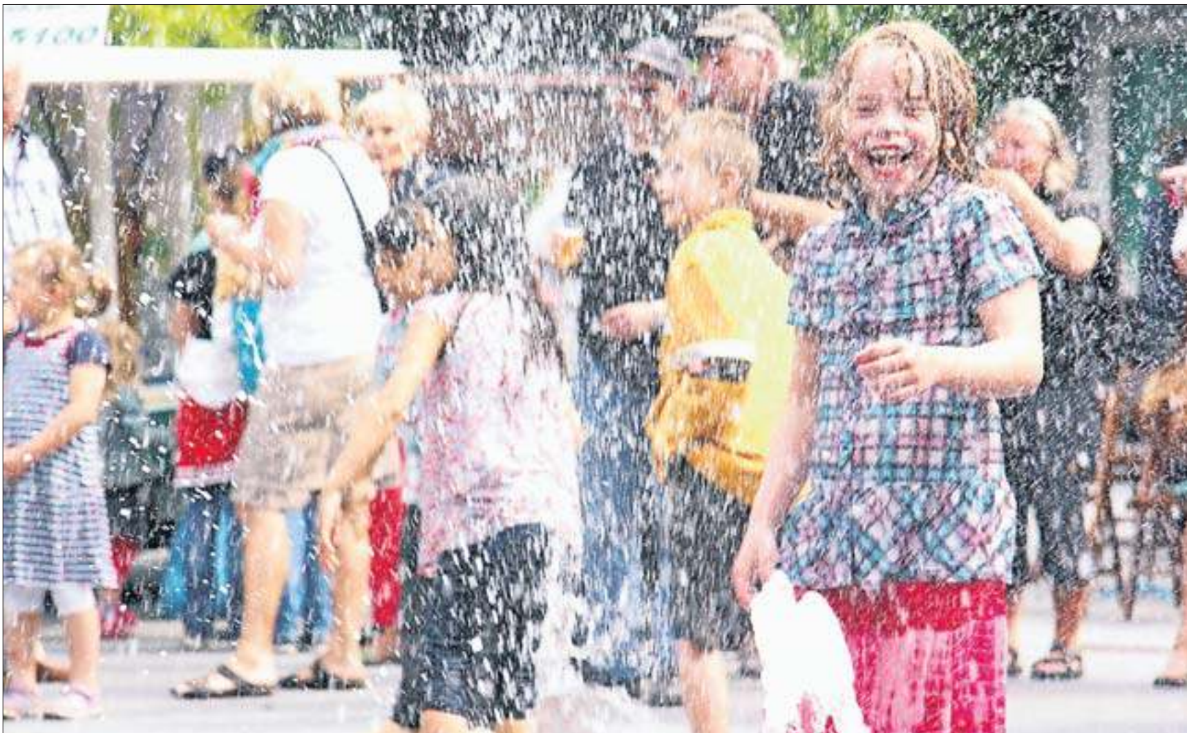
Das machte richtig Spaß. Bei der Übergabe des neuen Springbrunnens an die Bevölkerung am vergangenen Sonntag hatten vor allem die Kinder ihre helle Freude und tobten sich zwischen den Fontänen richtig aus. Lesen Sie mehr zur offiziellen Eröffnung auf Seite 4.