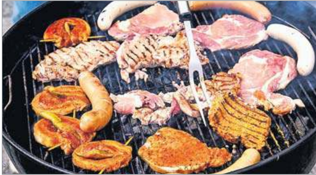
Die Standardvariante: Bei der Grillmeisterschaft am kommenden Sonntag werden Grillmeister diesen Standard nach oben schrauben.

Nicht nur die eingeübte Grilltechnik wird somit bewertet, die Hobbygriller müssen sich auch in Kreativität und Spontaneität beweisen. Zehn Teams mit originellen Namen wie „Koarkerker Firefighters“ „Rek-