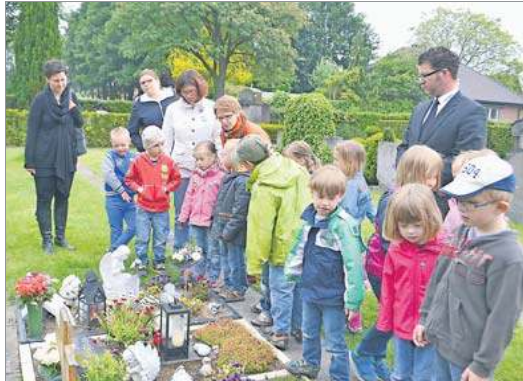
Die Seele ist längst im Himmel: Die Kinder der Integrativen Kindertagesstätte besuchen den Friedhof in Kaldenkirchen.